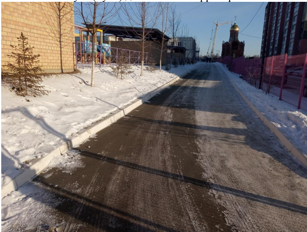
Путь (пути) движения на территории