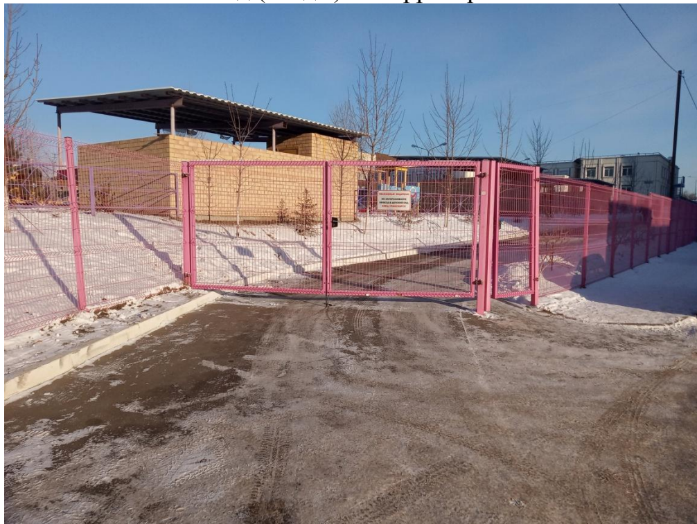
Вход (входы) на территорию