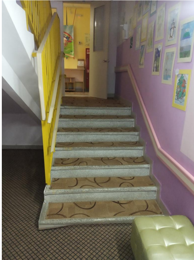
Лестница (внутри здания)