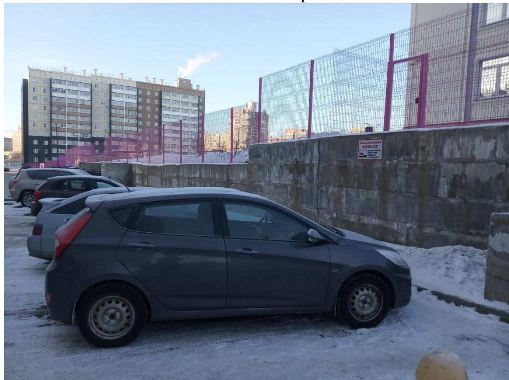
Автостоянка и парковка